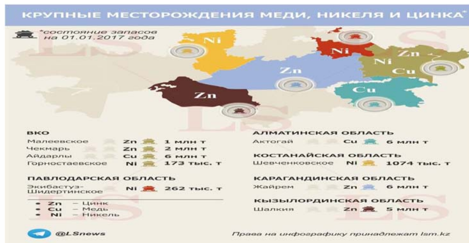
نقشه پراکندگی جغرافیای معادن در قزاقستان

شایان ذکر است تولید روی در دهه ۱۹۸۰ به اوج خود رسیده ، اما در سال های اخیر میزان تولید روی این